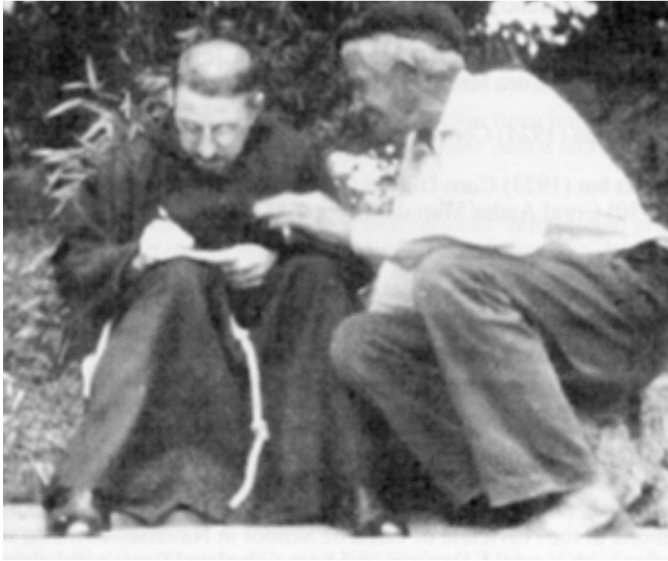
Abesti bat jasotzen. Recogiendo una canción. Gathering a song. (circa 1910).